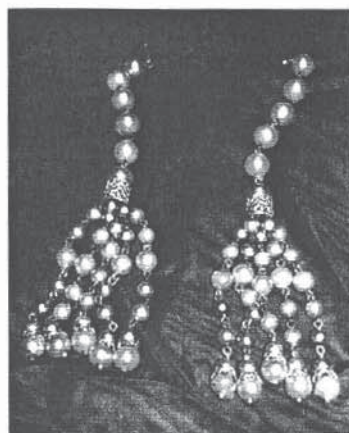
A sinistra, Maria Callas in Anna Bolena e in basso in La Vestale, 1954. Sopra, un paio di orecchini di scena provenienti dalla collezione Nocera e sotto un abito di scena appartenente alla stessa collezione. Per tutte le altre foto dell'articolo, si ringrazia l'Associazione Maria Callas