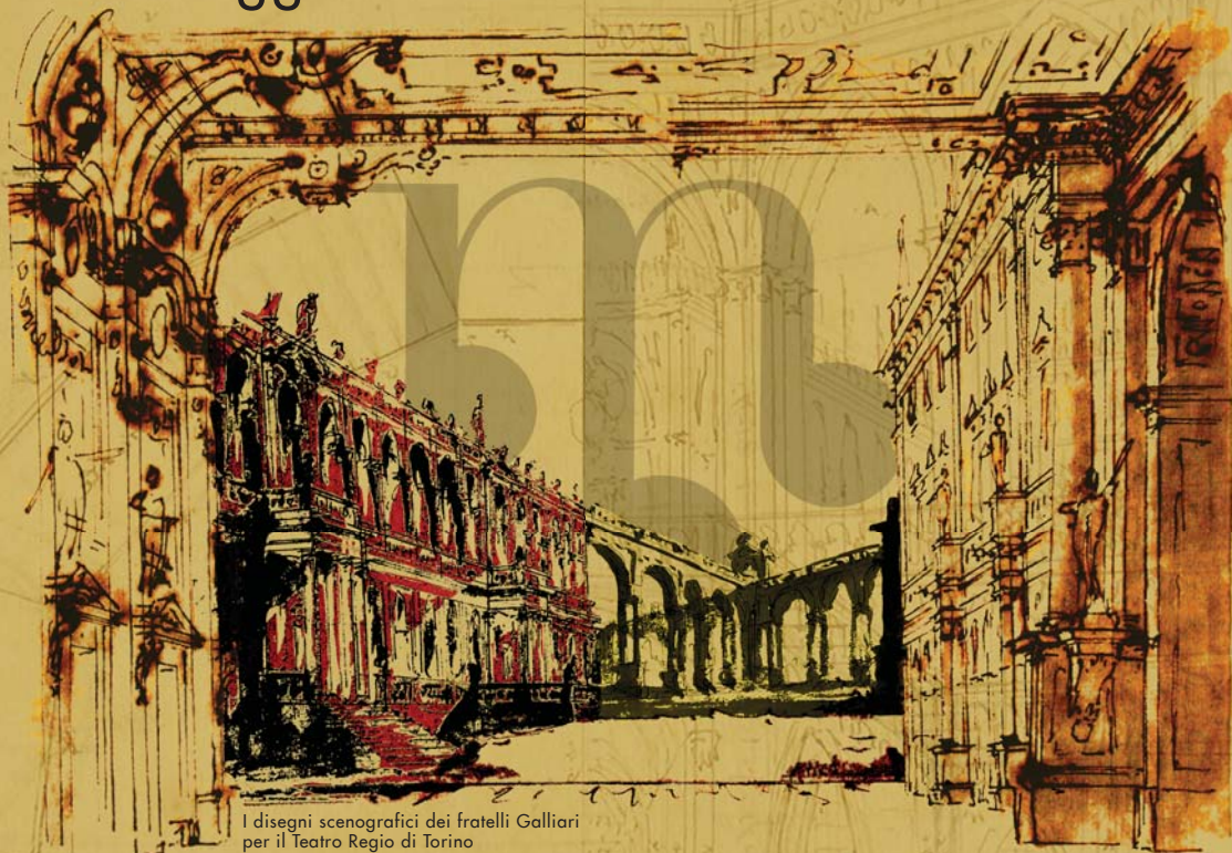
I disegni scenografici dei fratelli Galliani per il Teatro Regio di Torino